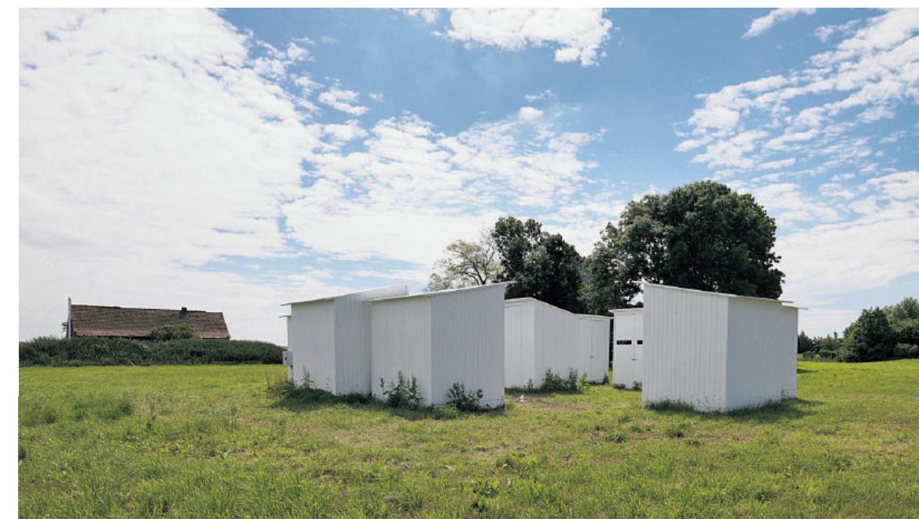
Installatie 'Cask': in elk van de huisjes is een solotentoonstelling te zien.