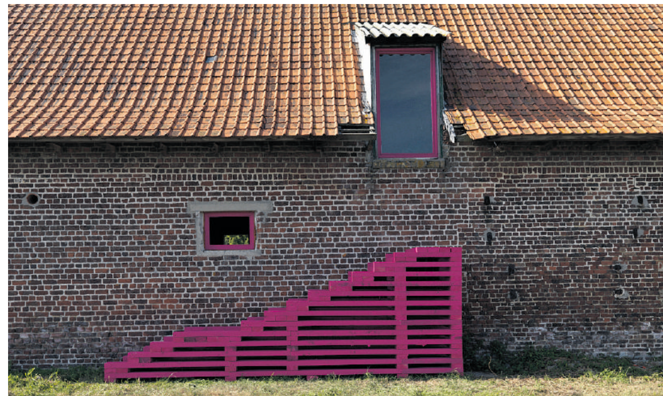
Installatie in Het Blauhuys van schrijver Oscar van den Boogaard en diverse kunstenaars.